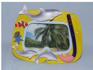
FOTO OKVIR MAJICA OD POLYREISA 11-1320-A,B 23x20 cm